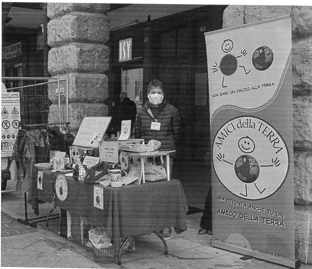
Banchetto allestito in via Cavour.