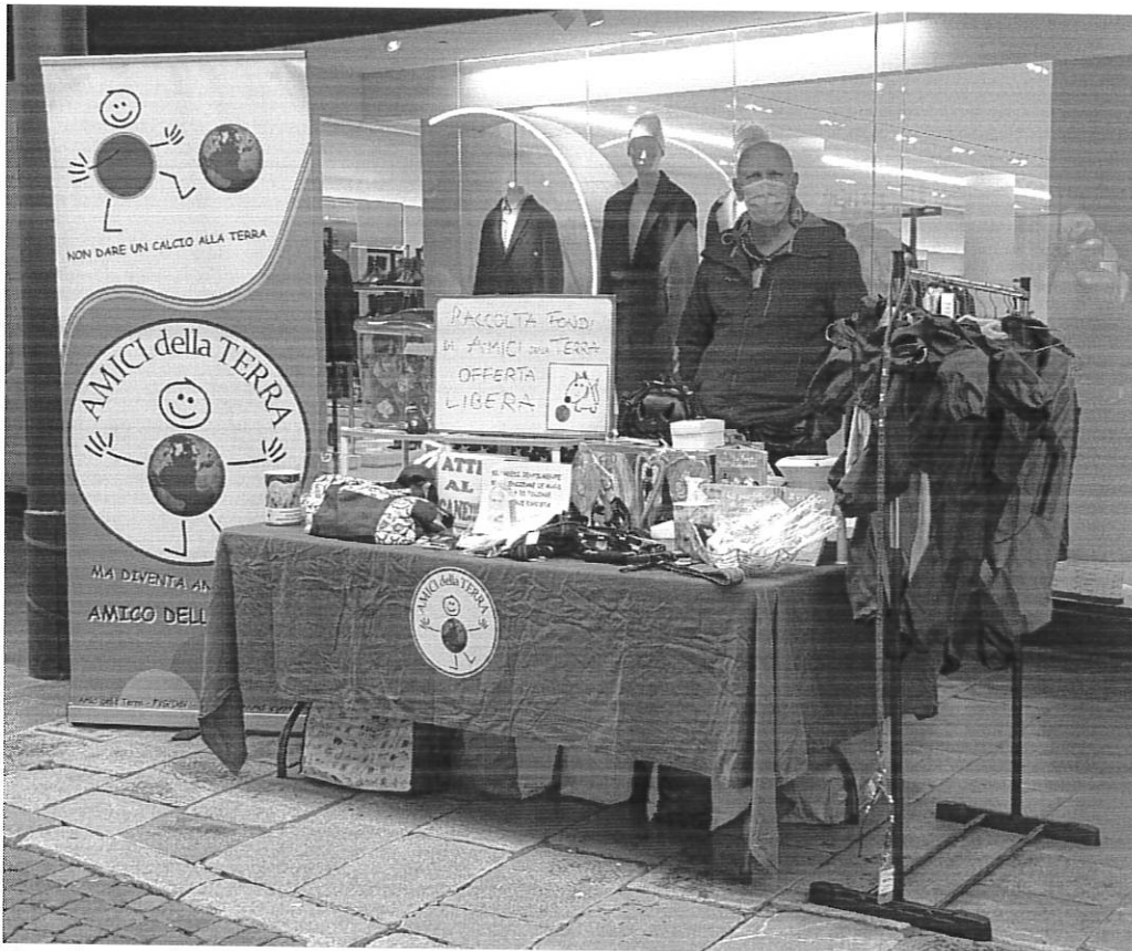
Banchetto allestito in via Canciani.